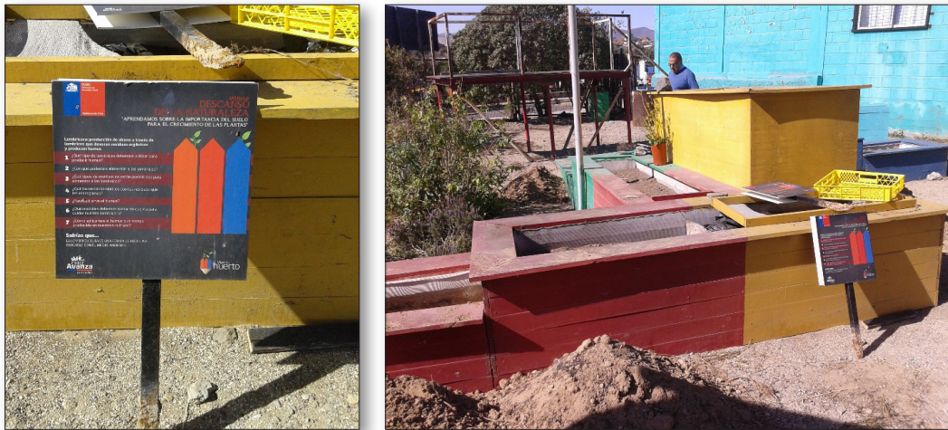
Fig. 1. Estructura física del huerto escolar del Colegio José Miguel Ferreira, Huasco, Chile.

Este huerto fue impulsado en 2013 por el Ayuntamiento, a través de un proyecto del Fondo de Solidaridad e Inversión Social (FOSIS) del Gobierno de Chile. La escuela, gracias al compromiso firme de un profesor, logró mantenerlo por dos años, periodo tras el cual acabó la financiación.